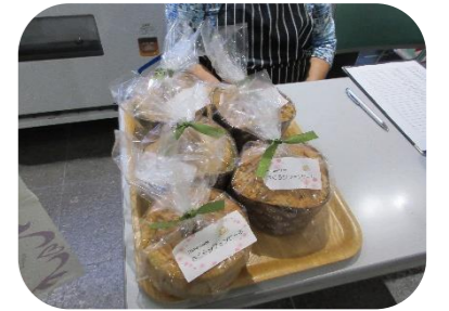
わらび市民ネットカフェも 大好評でした♪

【感想より】・曲の背景を知ることが出来て、よい機会になりました。・とても楽しく合唱に参加させて頂いています。ありがとうございました。・楽しく過ごせました。ありがとうございました。