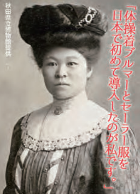
「体操着ブルマー」とセーラー服を日本で初めて導入したのが私です。」

わらび座 いらだて青空 天高唱 https://youtube.com/WRABI-XO