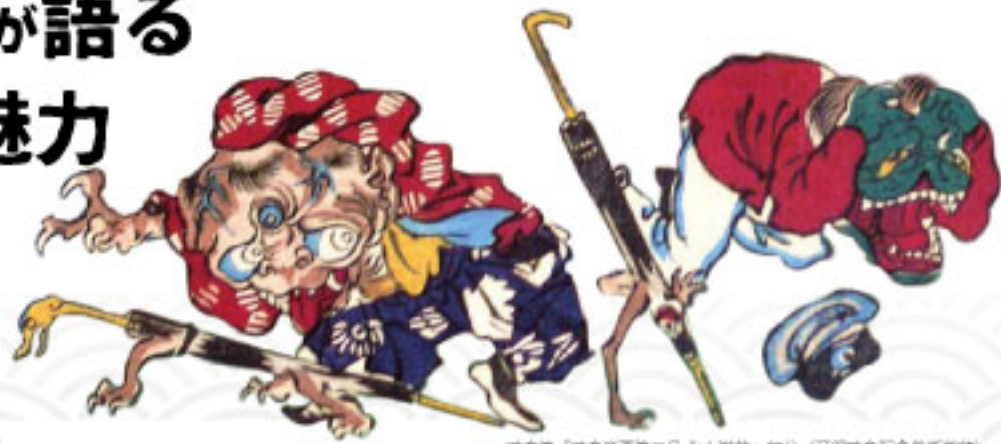
暁斎画「暁斎英画第三号 七女学校」部分（河鍋暁斎記念美術館蔵）