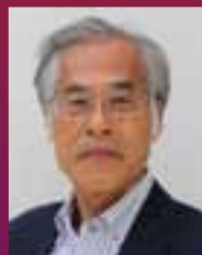
藤森照信 (建築史家・建築家)