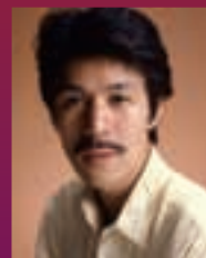
山口 晃 (画家)