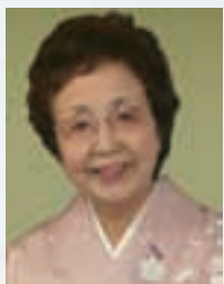
かわななほこすみ 河鍋楠美

画家。1969年、東京生まれ。群馬県桐生市に育つ。東京藝術大学大学院美術研究科絵画専攻（油画）修士課程修了。2001年第4回岡本太郎記念現代芸術大賞優秀賞。2013年『へんな日本美術史』（祥伝社）で第12回小林秀雄賞受賞。時空が混在し、古今東西様々な事象や風俗が、卓越した画力によって描き込まれた都市鳥瞰図・合戦図などが代表作。絵画のみならず立体、漫画、インスタレーションなど表現方法は多岐に渡る。2013年個展「山口晃展 画業ほぼ総覧—お絵描きから現在まで」（群馬県立館林美術館、群馬）、ほか個展多数開催。近著に『山口晃大画面作品集』（青幻舎）、『すゞしろ日記 弐』（羽鳥書店）