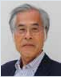
ふじもりてるのぶ 藤森照信