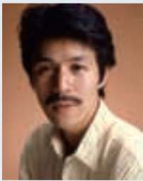
やまぐちあきら 山口晃

建築史家・建築家。1946年、長野県生まれ。東京大学大学院博士課程修了。専攻は近代建築、都市計画史。近代建築・都市史研究の第一人者として活躍。工学院大学特任教授。東京大学名誉教授。86年、赤瀬川原平、南伸坊らと路上観察学会を結成。91年、神長官守矢史料館で建築家としてデビュー。自邸「タンポポハウス」や赤瀬川原平邸「ニラハウス」、茶室「高過庵」など、独創的な建築も手がける。著書に『人類と建築の歴史』『建築史的モンダイ』（ともに筑摩書房）、『建築とは何か』（エクスナレッジ）、『藤森照信の茶室学』（六耀社）、『日本建築集中講義』共著 / 山口晃（淡交社）、ほか多数