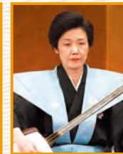
鶴澤津賀寿 人間国宝