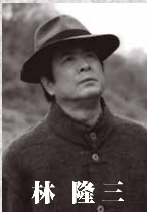
林 隆 三

1966年に俳優座養成所を第15期生として卒業。翌年NHKミュージカル「ある愛の奇跡の物語」でデビューする。その後、テレビでは、“NHK”「天下御免」「国盗り物語」「夢千代日記」「たけしくん、ハイ!」「信長」「葵~徳川三代~」「利家とまつ」、 “TBS”「誘惑」「A round40」、 “フジテレビ”「ドク」「チーム・バチスタの栄光」などに出演。映画では、「妹」「地獄」「早春物語」「三たびの海峡」「時雨の記」「草の乱」などに出演。舞台では、「どん底」「ファンタスティックス」「美しきものの伝説」「三文オペラ」「東京タワー オカンとボクと、時々、オトン」などに出演。