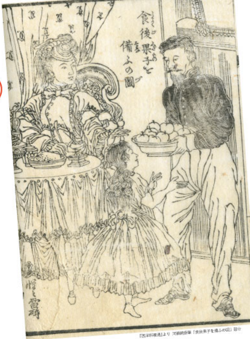
『西洋料理通』より 河鍋晩齋「食後果子を備ふの圖」部分